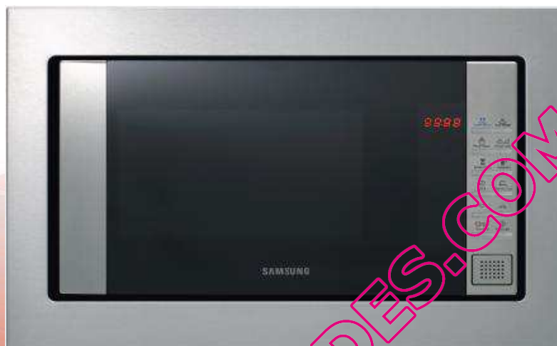
Visuel non contractuel